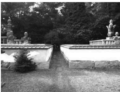
図4. 初代藩主と3代藩主の墓

凧見観音菩薩は、高さ92cmの一面四臂の聖観音立像の石仏であり、かつての信仰者の方が縫った赤い帽子を被り、前掛けを掛けていた。本観音像の背面には、足底から上方77cmの部位に、幅7.5cm、高さ6cm、上部の奥行き6cm、下部の奥行き5cmの窪みが確認された(図5)。また、窪みの周囲には、煤の沈着が確認された(図6)。