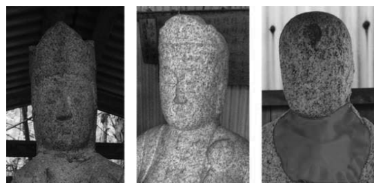
図7. 古国分周辺の石仏 左：風見観音菩薩(年不明) 中：乳母観音菩薩(年不明) 右：桜井浜の地藏墓(享保21年)